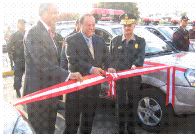
Ismael Benavides, ex-presidente de ASBANC, realiza entrega de equipos a Luis Alva Castro, Ministro del Interior.

La donación consistió en 18 camionetas y 34 motocicletas, equipados con sistemas de luz, sonido y comunicaciones, incluyendo equipos GPS en el caso de las camionetas. Las referidas unidades serán destinadas a la ciudad de Lima, así como a otras ocho ciudades del interior del país. También se hizo entrega de 194 chalecos